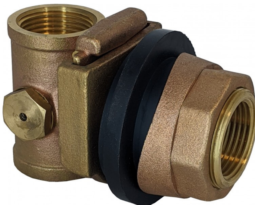
АДАПТЕР СКВАЖИННЫЙ СО СЛИВНЫМ КЛАПАНОМ АРТИКУЛ: VER390